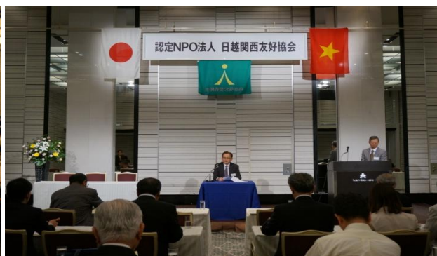
総会議長に選任された築野新理事長