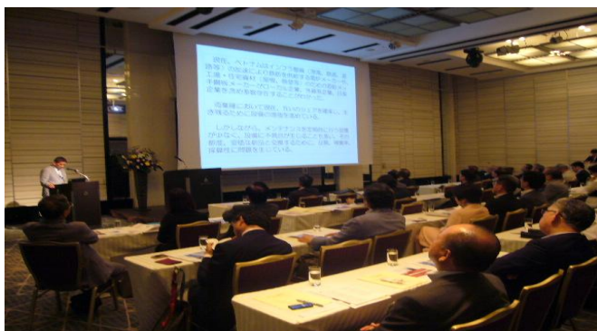
セミナー 講演風景