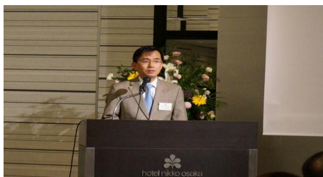
セミナー第1部講演中のビン総領事